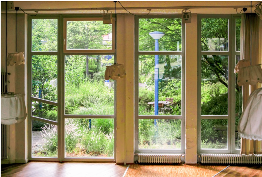
Blick in den begrüntem Hof